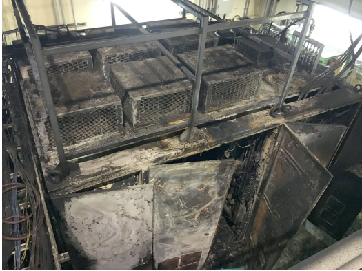
Figure 3: Burnt pulsed high-power rf modulator.