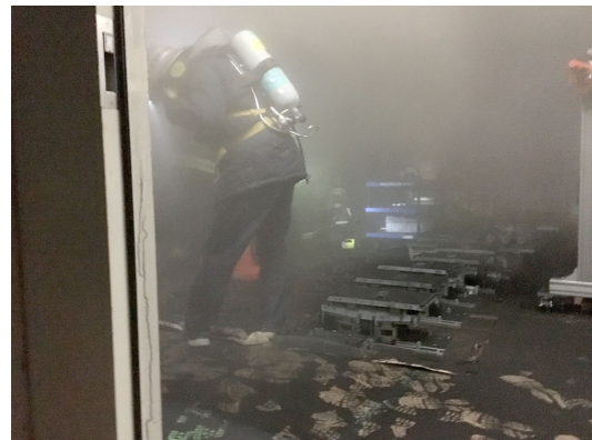
Figure 2: A fireman entering into the burnt room.

案内した。加速管準備室のシャッターが熱くなっていないことや、放射線は既に発生していないはずなどの状況検討を入射器棟東側にて行なった。その後、消防士 6 人と放射線取扱主任者である放射線科学センター長が、放射線防護や酸素マスクの対策を行った上で、23 時 15 分ごろから現場に入り、放射線や熱などの危険が無いことが確認された (Fig. 2)。