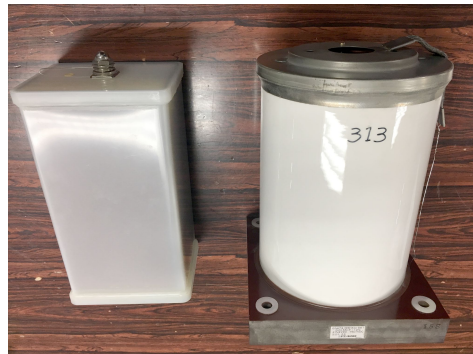
Figure 5: Capacitors of the Nextef modulator (right), and of the injector linac.

ちなみに、今回 Nextef のパルス変調器で使用されていたコンデンサは Fig. 5 (左) のようにプラスチック容器であったが、電子陽電子入射器本体において同様の目的のために 60 台、20-40 年使用されている大電力パルス変調器のコンデンサは、セラミクスと金属の容器である。また、電位傾度 (誘電体の単位厚み当たりの印加電圧) について、Nextef の 52.8 \text{ V}/\mu\text{m} に対して入射器では 43.6 \text{ V}/\mu\text{m} と安全重視で余裕を持って設計されている。さらに破裂しないように防爆装置を備えている。