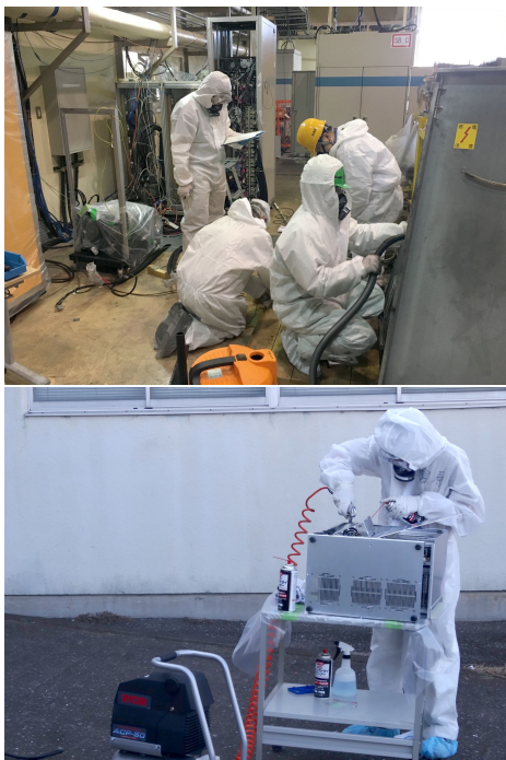
Figure 7: Intensive clean-up work continued for three weeks.

それぞれの解決に数日を要する事案も多く、毎朝全員による復旧作業進捗打ち合わせを持ち、夕方には各グループ責任者による打ち合わせを持ち、漏れがないような効率的な作業を心掛けた。また、情報交換のために、毎日 Mail による情報共有と、Web による情報集約、重要情報の入射器棟玄関での掲示を行った (Fig. 8)。