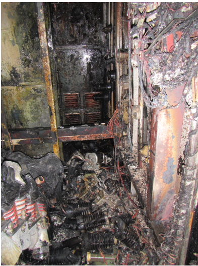
Figure 4: Space where pulse-forming network was installed and burnt.

ク容器のコンデンサが寿命により破裂し、漏れた絶縁油が高電圧放電により着火したという可能性が指摘されている。