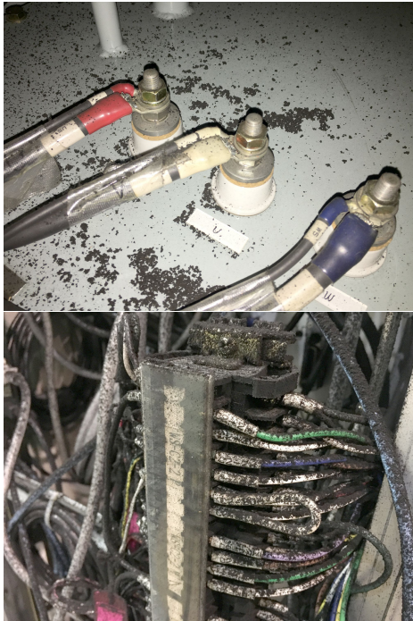
Figure 6: Carbon soot sneaked into injector components.