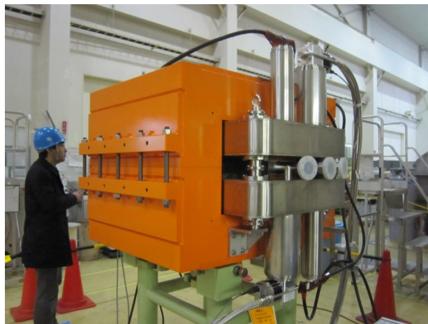
Figure 3: HTS switching magnet.

度は、冷凍機近辺と反対側の 2 カ所でセルノックス温度計で測定されている。初期冷却試験では、全測