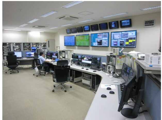
Figure 4: Refreshed control room.