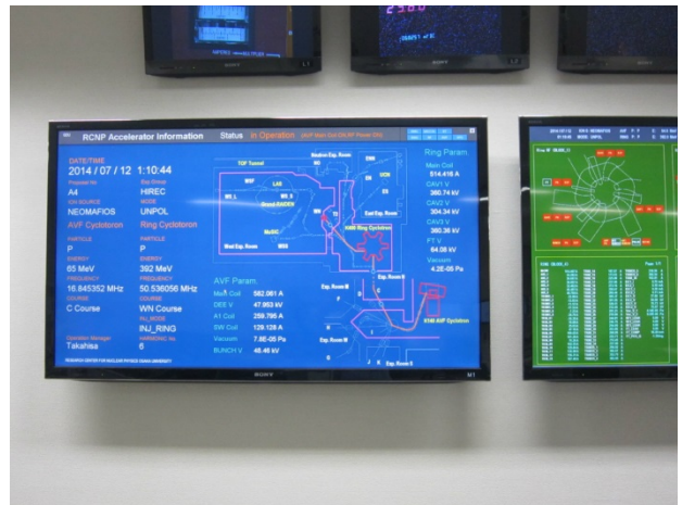
Figure 5: GCU to display the operation status.