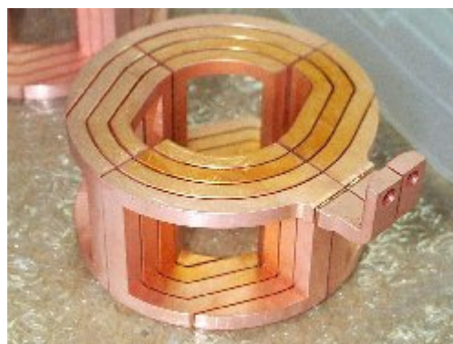
図2 栄コイルの概観

な磁極に巻く際の曲げR制限等で、実際には余りコイル部の体積を減らせないため、DT小型化のためにはR部の無いコイルのニーズがあった。そこでロストワックス法を用いた銅電鍍により、中空溝を形成し、銅ブロック材からコイルを削り出しで製作した。図2に電鍍コイル（通称“栄コイル”）の外観を示す。接続端子をロウ付けするため、本コイルの銅電鍍層（1mm厚）はロウ付け温度でも熱的に安定で、変形しない事が要求される。従って、銅電鍍は必然的にPR法となる。